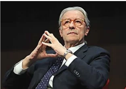
Feltri a Salvini: "Risparmi dei cittadini per il Paese? Una vaccata"