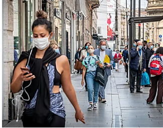
Coronavirus, Silvestri: "Numeri ok, andiamo verso la fine"