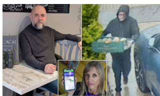
Il vendica di frutta fuggitivo cacciato da tre forze di polizia