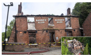
Il pub più intriso della Gran Bretagna viene distrutto da un incendio