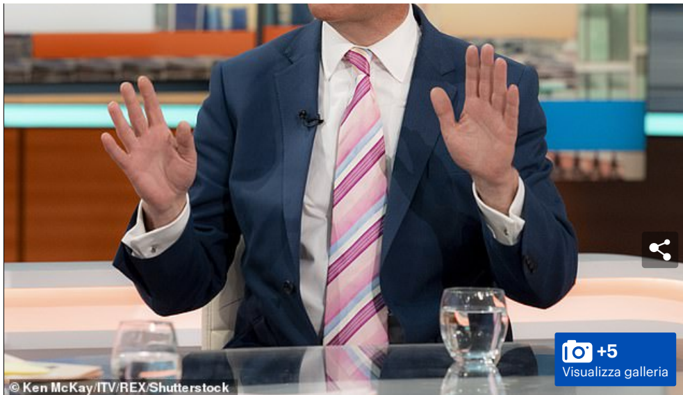
Nigel Farage (nella foto) ha creato un nuovo sito web per aiutare le persone che hanno avuto i loro conti bancari cancellati in mezzo a un "grande scandalo nazionale" di debanking