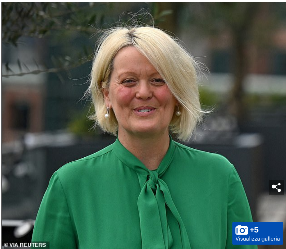
Il signor Farage ha chiuso il suo conto Coutts a causa delle sue opinioni politiche che hanno portato alle dimissioni di Dame Alison Rose (nella foto), l'amministratore delegato della sua banca madre NatWest e l'amministratore delegato di Coutts Peter Flavel