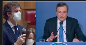
Covid, Draghi: "Nuove misure? Valutiamo mascherine all'aperto, Ffp2 in certi ambienti al chiuso e tamponi per chi è vaccinato"