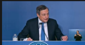
Referendum Eutanasia e Cannabis, Draghi: "Governo non ha alcuna intenzione di costituirsi contro l'ammissibilità"