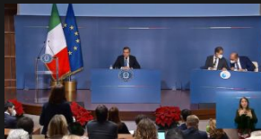
"Il Quirinale? La decisione è nelle mani delle forze politiche". Tutti le aperture di Draghi alla sua corsa al Colle: il video