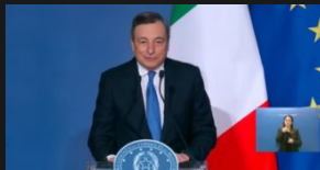
Obbligo vaccinale, Draghi: "Resta sempre sullo sfondo, non è mai stato escluso"