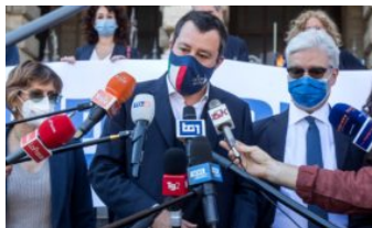
Matteo Salvini si è vaccinato contro il Covid. Dopo il richiamo di Draghi anche il leader della Lega ha fatto la prima dose a Milano