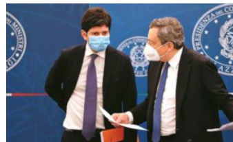
Nuovo decreto Covid, dal 6 agosto green pass per ristoranti al chiuso, palestre, cinema. Draghi: "Condizione per tenere attività aperte"