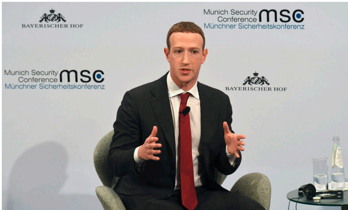
Il fondatore e CEO di Facebook, Mark Zuckerberg, parla durante la 56a Conferenza sulla sicurezza di Monaco (MSC) a Monaco il 15 febbraio 2020.