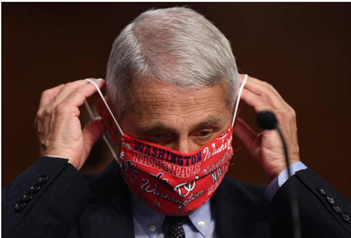
Il dottor Anthony Fauci, direttore del National Institute for Allergy and Infectious Diseases, abbassa la maschera prima di testimoniare davanti a una commissione del Senato a Washington il 30 giugno 2020.