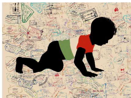
Illustrazione di Beppe Giacobbe

La proposta di legge che va sotto il nome di ius culturae si propone di dare la cittadinanza italiana a tutti i giovani immigrati minorenni i quali, anche se non nati nella Penisola, abbiano tuttavia frequentato con profitto qui da noi almeno un ciclo scolastico di cinque anni o un corso di formazione professionale triennale. Come ho già detto in un articolo precedente, sono personalmente convinto che sia un precipuo interesse dell'Italia