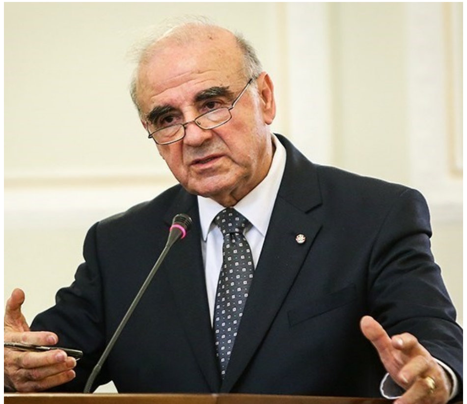
George Vella.